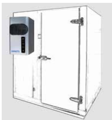
ザノッティ社 GM シリーズ