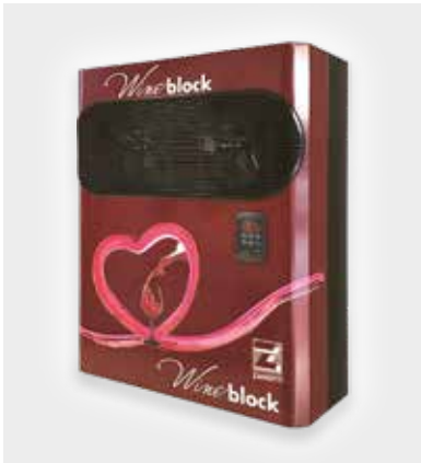
ザノッティ社製ワインセラー用モノブロック